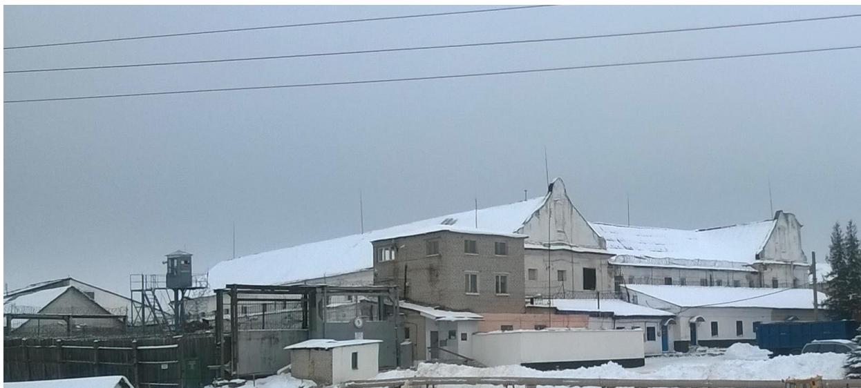
Исправительная колония №13, г. Глубокое.

В начале декабря 2016 года заключенный сообщил в ПЦ «Вясна» о том, что его корреспонденция не передается адресатам, в том числе – государственным органам; сам он опасается за свою жизнь и здоровье. Усилиями правозащитников (см. Приложение 3) удалось организовать выбытие представителя прокуратуры Глубокского района в колонию для встречи с заключенным. Во время встречи заключенный смог вручить представителю надзирающего органа заявление о привлечении к ответственности и даче правовой оценки действиям и систематическим превышениям служебных полномочий администрацией колонии в Глубоком.