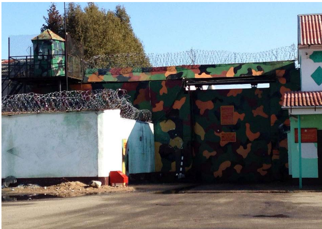
Исправительная колония №14 ст. Новосады Борисовскоо района.

Политзаключенный сообщает и о других проблемах с получением и отправкой писем: он пишет в среднем одно письмо в месяц каждому из своих друзей: