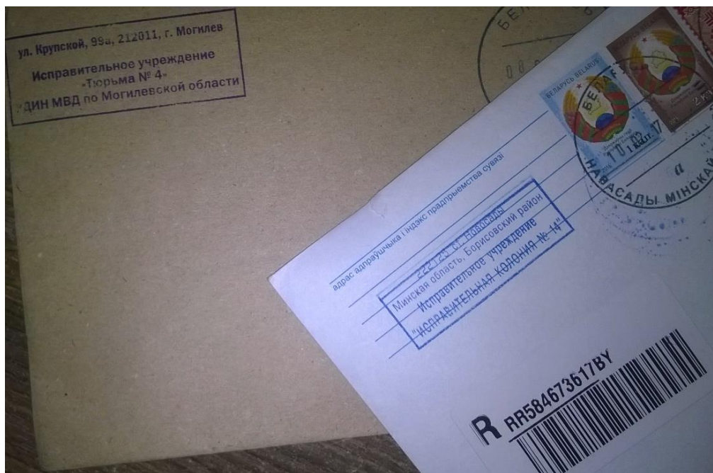
Корреспонденция из мест лишения свободы.

В Беларуси в соответствии с Уголовно-исполнительным кодексом, осужденным к лишению свободы разрешается получать и отправлять письма и телеграммы без ограничения их количества. Отправление писем и телеграмм осуществляется за счет осужденных. Корреспонденция, получаемая и отправляемая осужденными, за исключением предложений, заявлений и жалоб осужденных, адресованных в органы, осуществляющие государственный контроль и надзор за деятельностью учреждений, исполняющих наказания, подлежит цензуре. Переписка между содержащимися в исправительных учреждениях осужденными, не являющимися близкими родственниками, запрещается.