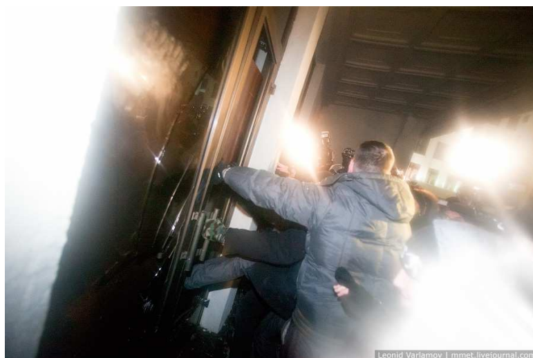
Неизвестные пытаются ворваться в Дом правительства

Как отмечалось выше, демонстрация проходила мирно, за исключением того, что небольшая группа позади толпы попыталась ворваться в Дом правительства. Очевидцы сообщили Amnesty International, что, помимо этой небольшой группы мужчин, стоявшей позади толпы, никто не держал в руках оружие или другие средства нападения. Однако в сюжетах государственного телевидения показывали площадь после демонстрации, усыпанную палками, лопатами и топорами. Очевидцы утверждают, что силовые структуры намеренно подбросили эти предметы, чтобы обвинить демонстрантов.