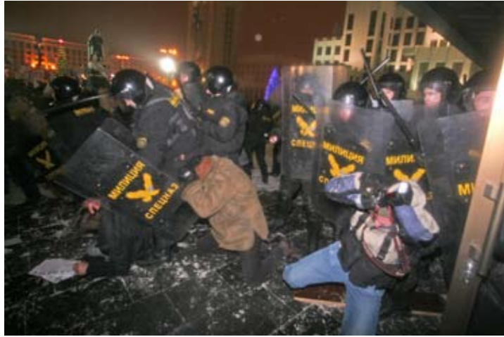
Журналисты под ударами дубинок 19 декабря 2010 г.

19 декабря 2010 г. многие журналисты находились на площади для подготовки материалов для своих изданий. В момент массовых избирательных действий ОМОНа, 27 журналистов были арестованы с применением грубой силы. Причем, ни заметный знак “Пресса” на одежде журналистов, ни их рабочие удостоверения не оказывали никакого эффекта. В ряде случаев, отличительные знаки работников прессы были сорваны или даже разорваны сотрудниками ОМОНа, непосредственно перед задержанием.