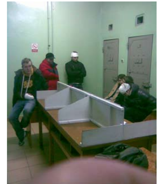
В ИВС на улице Окрестина, 19 декабря 2010 г.